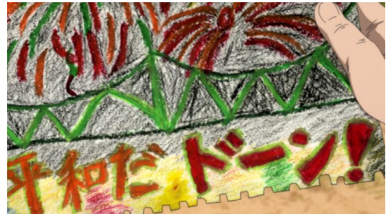
▲平成28年度大島小学校5年生が描いた花火の絵