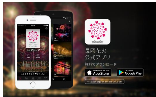
▲長岡花火公式アプリの待ち受け画面