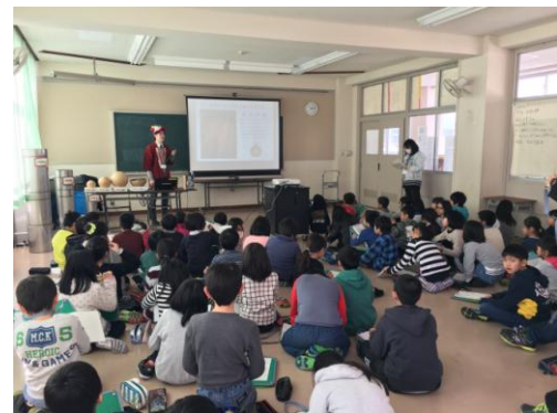
▲長岡花火の普及啓発活動の様子