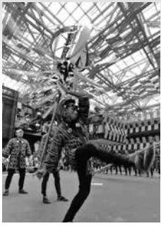
木やり、まとい、梯子乗り 今年も粋(イキ)に威勢よく、演技を披露します！