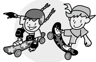
ボードスポーツ 2020年東京オリンピックの追加種目になったボードスポーツ。君も体験してみよう！