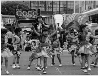
鵬よさこい節 みなさんに元気をお届けします！