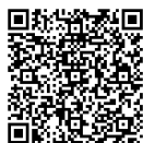
長岡花火 公式アプリ

なお今年は、長岡花火道路交通情報アプリを公式アプリに統合し、過去の渋滞状況や駐車場情報がリアルタイムで分かるようになりました。また、会場内の施設位置が分かるマップ機能が追加になるなど、新機能を加えてパワーアップしました。