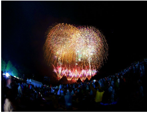
長岡米百俵フェス～花火と食と音楽と～2023