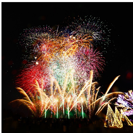
R5.11.25 長岡花火ウインターファンタジー