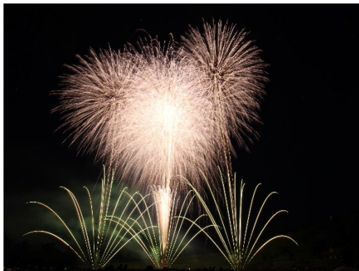
長岡花火ローズファンタジー