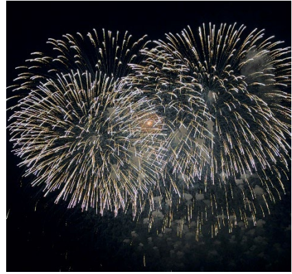
長岡雪しかまつり