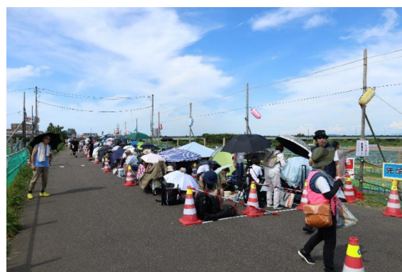
8/2 14:20頃 B会場南エリア席待機列の状況