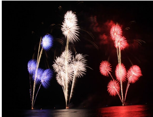
ホノルルフェスティバル