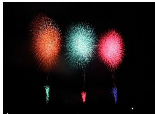
アフィニス夏の音楽祭 2023 Nagaoka